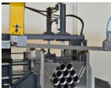
HİDROLİK ÜST BASKI