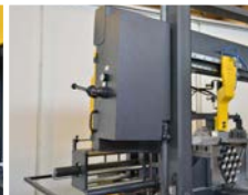
HİDROMEKANİK ŞERİT GERME