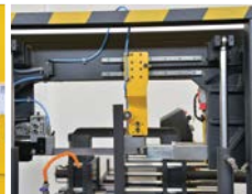
MALZEME GENİŞLİK AYARI